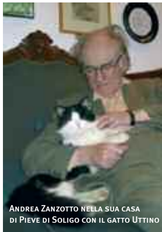
ANDREA ZANZOTTO NELLA SUA CASA DI PIEVE DI SOLIGO CON IL GATTO UTTINO