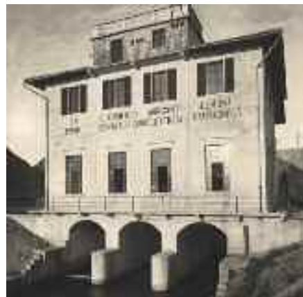
LA CENTRALINA DI CAMPAGNOLA COSTRUITA NEL 1921

• Agosto 2005: la fabbrica chiude. Una inaspettata fiammata di concorrenza sul mercato interno e la concorrenza asiatica spengono le ultime speranze e resistenze.