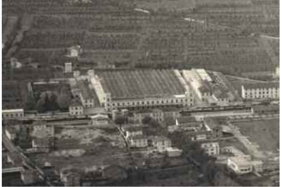
LA MANIFATTURA NEGLI ANNI '50

I lavoratori provenivano da Gemona e dal circondario. Nel 1993, su 438 dipendenti l'83% era di Gemona, il 3% di Artegna, Venzona e Trasaghis, il rimanente 8% proveniva da altri comuni. Probabilmente prima degli anni '60,