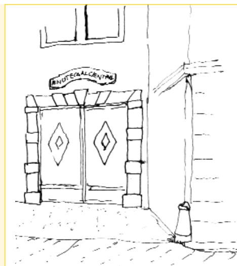
Enoteca "Al Centrâl"

Guardiamo il colosso di san Cristoforo , il più grande mai realizzato in pietra, e lo