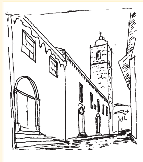
La Chiesa di San Giovanni