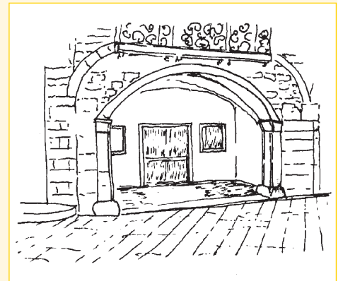
Ingresso Museo Civico Palazzo Elti

Questo era il più bel palazzo cittadino. Ancora riconoscibili dopo la quasi completa distruzione del sisma, gli stilemi dell'architettura rinascimentale. Fu acquistato e senz'altro ampliato e ristrutturato da Andrea Helt , appartenente ad una ricca famiglia di mercanti del salisburghese e poi entrato nella nobiltà locale con il nome italianizzato di Elti.