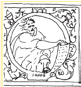
Lacunario di Pomponio Amalteo

Ma soffermiamoci un momento ad ammirare l'altare maggiore che riquadra l'immagine ad affresco della Madonna miracolosa e che rappresenta molto bene le opere di Gerolamo Comuzzo e il periodo tardo barocco locale.