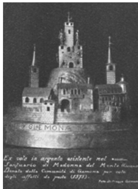
Ex voto donato dalla Comunità di Gemona al santuario di Castelmonte alla fine della pestilenza (da G. Clonfero: Gemona del Friuli, Udine 1974)

Le relazioni finali prodotte dagli studenti costituiscono la base di uno studio pubblicato grazie al finanziamento del Comune di Gemona. Quei testi, fondati sulla silloge di documenti presentata nella seconda parte del volume, sono stati elaborati in varia misura, talora profondamente, ed integrati con informazioni desunte da fonti diverse, in particolare da altri documenti dell'archivio storico di Gemona, rientrato in sede nell'estate del 2004. Anche l'approfondimento degli aspetti biologici della peste ha trovato la conclusione in una relazione che è compresa nel volume.